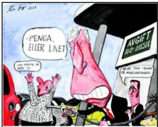
Tegning: ROAR HAGEN

«Ja, men i følge en undersøkelse så får vi jo hele 17 liter for en timelønn, da må det jo være billig.» - Hvis dette regnestykket