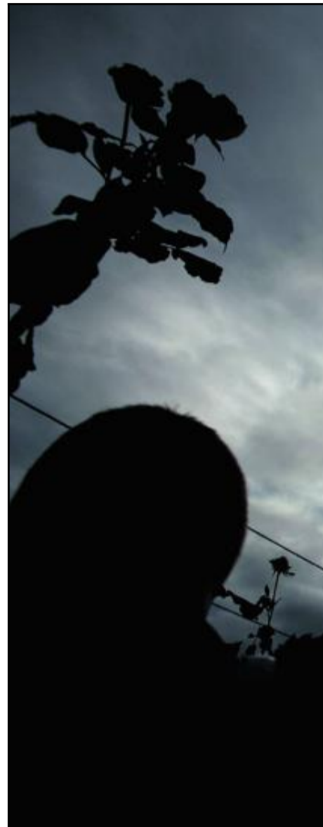
I SKYGGEN AV ROSENE: Når samhold

12. september er det kirkevalg og alle medlemmer i Den norske kirke kan stemme på den og de