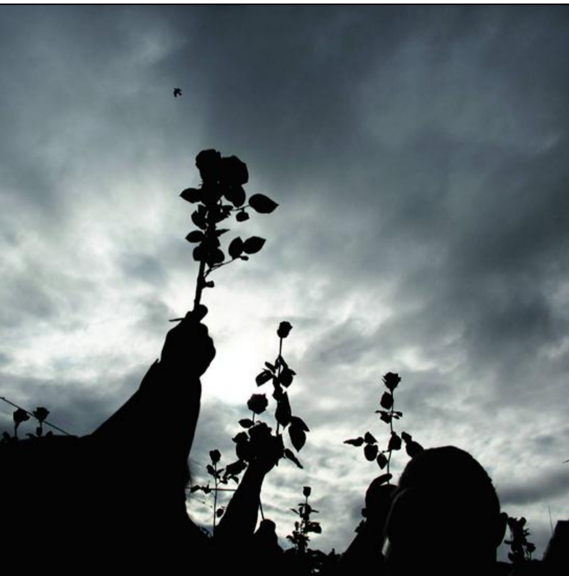
holdet blir sterkt til dem vi kjenner fra før, kan mobbeoffer og utstøtte føle seg enda mer utstøtt, advarer forfatteren.

nærhet også til det som er annerledes og ubehagelig.